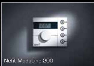
Nefit ModuLine 200