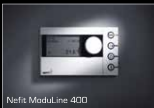
Nefit ModuLine 400