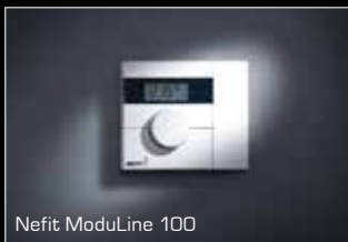
Nefit ModuLine 100

De TrendLine maakt gebruik van een geavanceerde regeling die zorgt voor een aangenaam gelijkmatige warmte en een laag energieverbruik. Daarvoor werkt hij samen met een intelligente, eenvoudig te bedienen Nefit ModuLine kamerthermostaat.