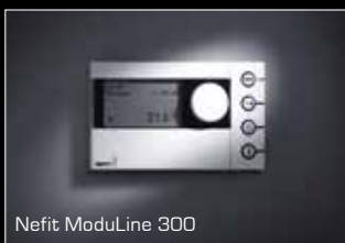
Nefit ModuLine 300